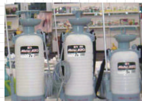
手動蓄圧式噴霧器