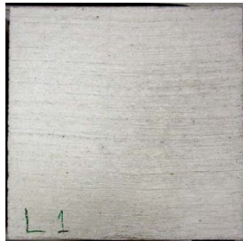
写真4 表面含浸材塗布試験体