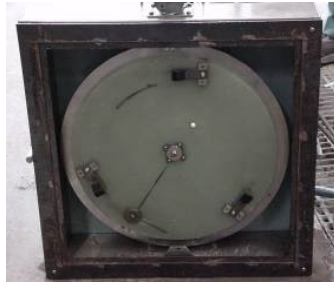
写真2 DF テスター (裏面)