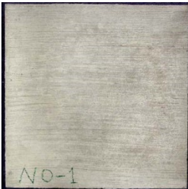
写真3 無塗布試験体